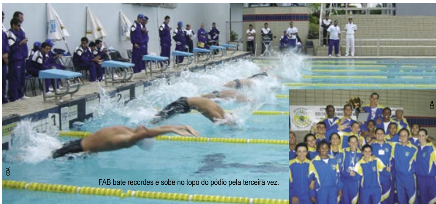
FAB bate recordes e sobe no topo do pódio pela terceira vez.

A equipe da Aeronáutica sagrou-se campeã pela terceira vez consecutiva no Campeonato Brasileiro de Natação das Forças Armadas. A XXXV edição da competição aconteceu nos dias 9 e 10 de julho, na Escola Naval, no Rio de Janeiro.