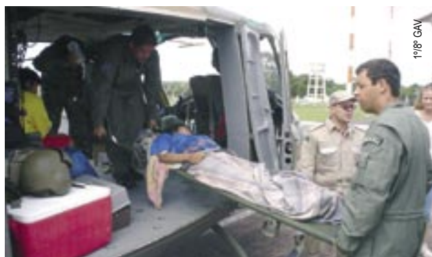
Jovem índia gestante chega a Macapá

Decolaram para Petrolina, a UTI aérea do Grupo de Transporte Especial (GTE), de Brasília, e um avião C-95 Bandeirante, do Segundo Esquadrão de Transporte Aéreo (2º ETA),