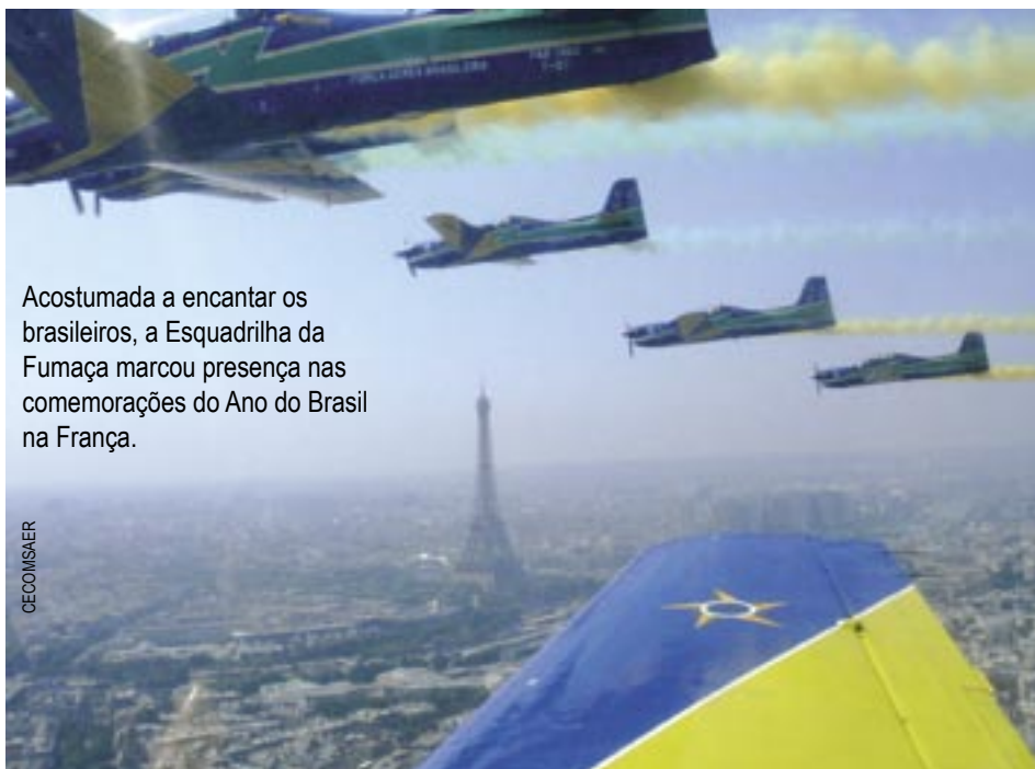
Acostumada a encantar os brasileiros, a Esquadrilha da Fumaça marcou presença nas comemorações do Ano do Brasil na França.

Para participar do desfile militar que recorda a Queda da Bastilha, foram três meses de cálculos e planejamentos. Mais de 9.000 km foram percorridos para chegar até Paris. Cada aeronave monomotor T-27 Tucano voou cerca de 30 horas, passando por Recife, Fernando de Noronha, Ilha